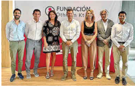
Presentación de la nueva convocatoria de la Fundación OK

A través de esta nueva línea de ayudas, la entidad sin ánimo de lucro pretende ayudar y promover iniciativas que mejoren la situación de los colectivos en situación de vulnerabilidad, y que fomenten la convivencia ciudadana, así co-