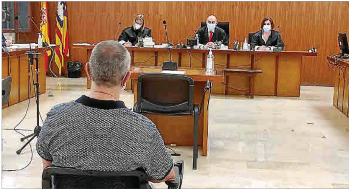
El acusado, durante el juicio en la Audiencia de Palma el pasado junio.