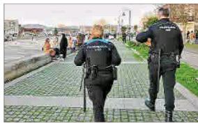
La Policía Local arrestó al sospechoso.