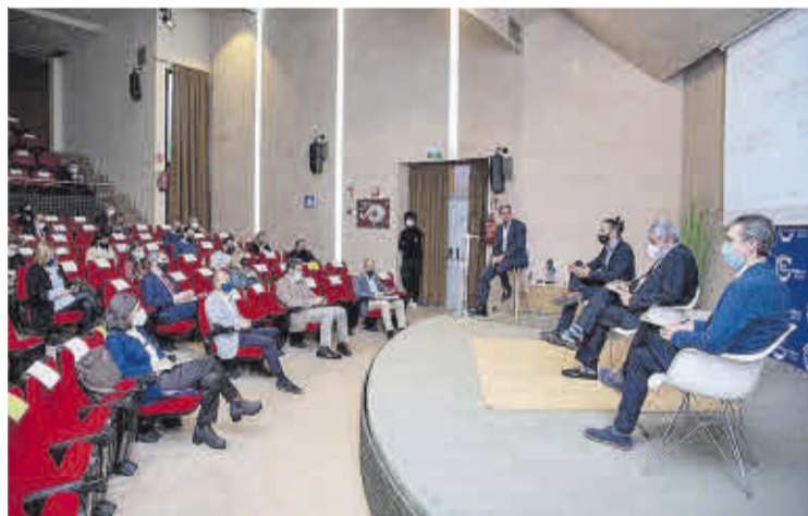
La primera mesa redonda que se celebró durante el foro.

“La Administración está promoviendo VPO de alquiler olvidando a la clase media y a los jóvenes”, criticó. En su opinión la solución no pasa por las expropiaciones aplicadas por el Govern. Los promotores se muestran contrarios a la desclasificación de los urbanizables porque aumenta el precio del suelo y agrava más el acceso de las familias