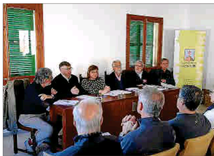
Acto de presentación de la entidad, ayer, en Montuïri.

La entidad tiene la intención de ser un observatorio de referencia de la comarca del interior de la Isla. Para ello se anunció que uno de sus primeros pasos será la recuperación de la publicación L'Observador