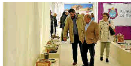
La carpa acoge una gran exposición de cerámica.

El programa incluye la conferencia a cargo del chef Miquel Calent Història de la cuina mallorquina , el showcooking sobre cocinas