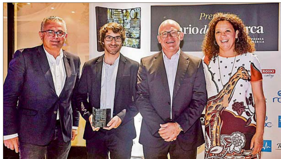
► El líder de El Pi, Jaume Font , el investigador premiado por Diario de Mallorca Toni Celià , el alcalde de sa Pobla, Llorenç Gelabert , y la próxima presidenta del Consell, Catalina Cladera , todos ellos poblers .