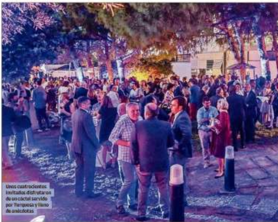
Unos cuatrocientos invitados disfrutaron de un cóctel servido por Turquesa y lino de anécdotas.