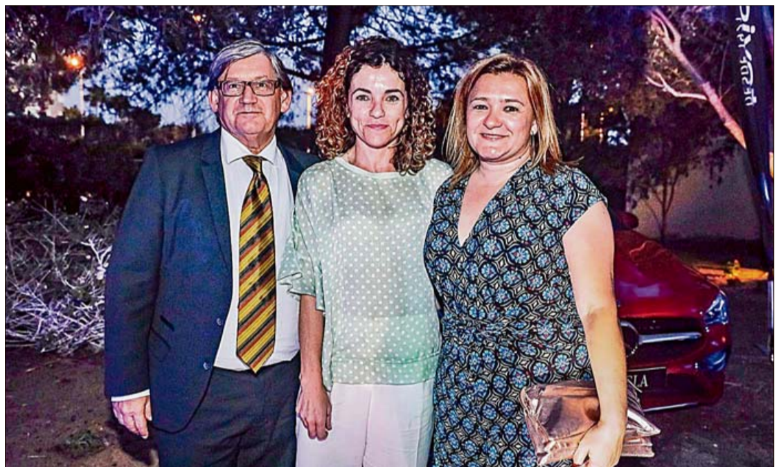
► El presidente del Parlament Vicenç Thomàs , la delegada del Gobierno en Balears Rosario Sánchez y la consellera insular de Territorio e Infraestructuras Mercedes Garrido no quisieron tampoco perderse la gala de este diario.

► La delegada del Gobierno, Rosario Sánchez, hizo su posible última aparición pública en el cargo en esta gala ► Hace un año su primer acto oficial fueron los premios de este periódico