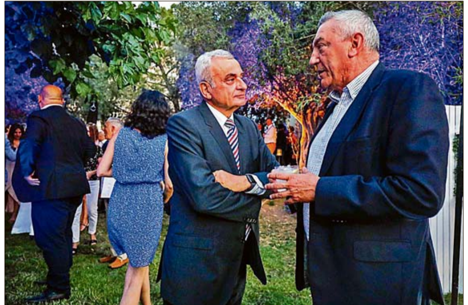
► El teniente general retirado Fulgencio Coll y el general de división y comandante general de Balears Juan Cifuentes mantuvieron una charla distendida durante el cóctel de este diario. Otrora Coll, cuando era el jefe del Estado Mayor del Ejército de Tierra, era el mando de Cifuentes.