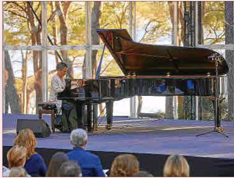
La pianista Maria Joao Pires durante el mágico concierto.