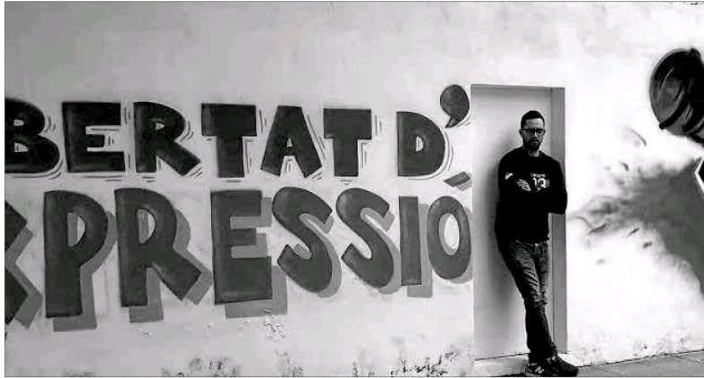
El rapero Valtonlyc, condenado a tres años y medio de prisión en una sentencia que ya es firme.